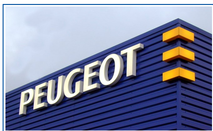
► Texte boîtier PMMA